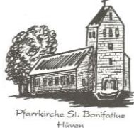
Pfarrkirche St. Bonifatius Hüven